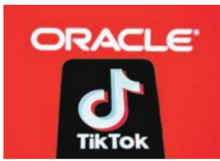
TikTok與甲骨文合作建議已送往華府待批。

TikTok前日發表聲明，指出公司已向美國政府提交計劃，相信可解決美國政府的安全疑慮，讓平台繼續在美國運作；其後以商用軟件為主要業務的甲骨文亦發表