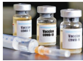
各國爭相研發疫苗，以遏制新冠疫情。

杜特爾特表示「只要俄羅斯與中國的疫苗與市場上的其他疫苗一樣好，我們就會優先考慮他們。」他也提到菲律賓採購