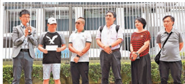
■ 旅遊業促進會總幹事、旅巴司機及其所屬車行指，香港旅遊業瀕臨崩潰，促政府止暴制亂。

示威者藉反修例進行的暴力衝擊引發社會混亂持續逾3個月，本港旅遊業受到災難性影響，導遊、旅行社職員、旅遊巴士司機等旅遊從業員均面對停工、減薪的狀況。昨日上午約60輛旅遊巴士在啟德承啟道出發，途經東隧、東區走廊及灣仔繞道，慢駛到政府總部，抗議近日暴力衝擊嚴重影響司機生計。有導遊更指現時情況非常嚴重，而且不知暴亂何時結束，許多同行已經開始報讀一些短期課程，考慮轉行，本港原本興旺的旅遊業將流失大量人才。