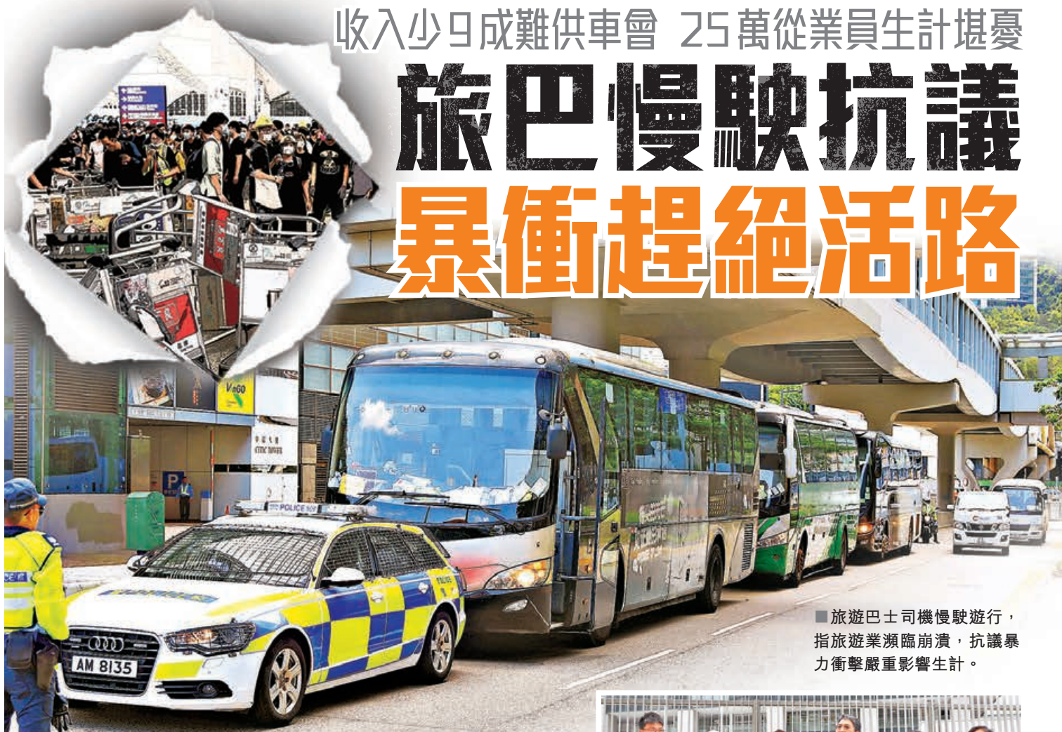
■ 旅遊巴士司機慢駛遊行，指旅遊業瀕臨崩潰，抗議暴力衝擊嚴重影響生計。

示威者藉反修例進行的暴力衝擊引發社會混亂持續逾3個月，本港旅遊業受到災難性影響，導遊、旅行社職員、旅遊巴士司機等旅遊從業員均面對停工、減薪的狀況。昨日上午約60輛旅遊巴士在啟德承啟道出發，途經東隧、東區走廊及灣仔繞道，慢駛到政府總部，抗議近日暴力衝擊嚴重影響司機生計。有導遊更指現時情況非常嚴重，而且不知暴亂何時結束，許多同行已經開始報讀一些短期課程，考慮轉行，本港原本興旺的旅遊業將流失大量人才。