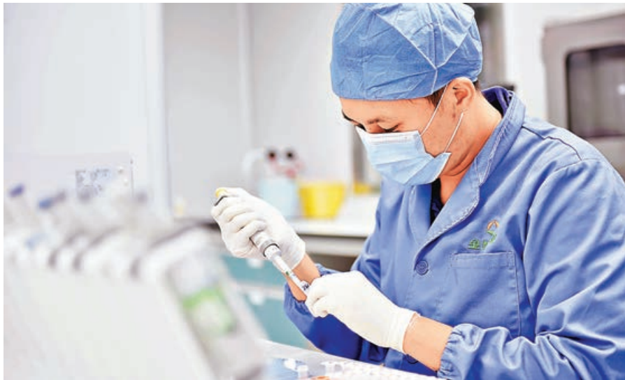
■ AI 輔助宮頸癌篩查技術在日後條件成熟時將在金域醫學香港實驗室推廣，港人亦受惠。

昨日，華為公司攜手第三方醫學檢驗機構金域醫學在廣州宣佈，雙方在人工智能（AI）輔助宮頸癌篩查技術取得突破性進展，識別僅需 36 秒，判讀速度是人工的 10 倍，宮頸細胞學陽性病變檢出率超過 99.9%，是全球已公佈 AI 輔助宮頸癌篩查檢出率的最高水平。據悉，該技術條件成熟時將在金域醫學香港實驗室推廣。