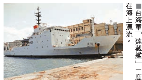
■ 台海軍「達觀艦」一度在海上漂流。

報道指，雖然此次遼寧艦並未進入日本領海海域，但該航母上一次通過此海域進入太平洋還是 3 年前的 2016 年 12 月。日本防衛省正分析此次航行的目的，並加強警戒。