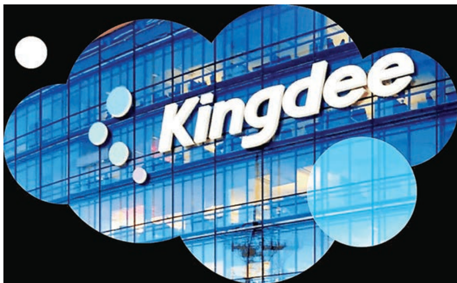
■金蝶預期雲業務持續有5成增長。