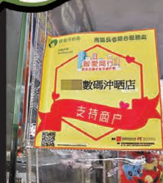
有支持計劃的商戶，將識別貼紙貼在當眼處。