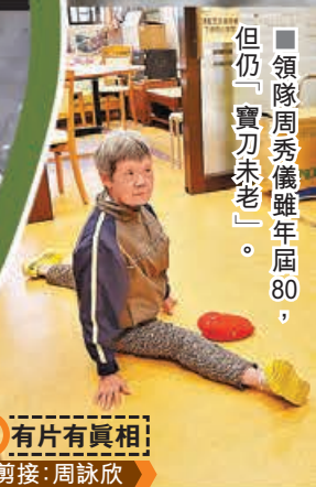
有片有真相！剪接：周詠欣

*請登入 lionrockdaily 香港仔 fb 專頁 https://www.facebook.com/lionrockdailyhk/ 瀏覽訪問內容，或用報頭旁掃條碼進入。