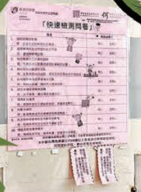
邨內張貼有關認知障礙症檢測問卷，長者可撕下中心聯絡方法作查詢。