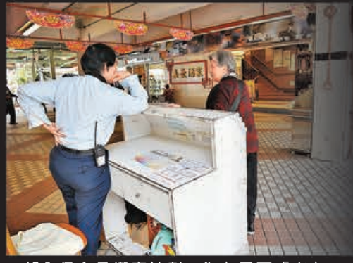
邨內保安員響應計劃，為有需要「老友記」提供服務。