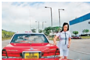
「學生妹」司機下車檢查的士。影片截圖

塵而去。片段吸引不少網民留言，有人指該「學生妹」其實是大叔，「唔係學生妹唔係學生哥係係佬」、「制服誘惑？」不過有人更斥片主駕駛行為，「人哋放生你，仲放人上網」、「咁都撞到車，真係好神奇」、「做乜隊學生妹？」