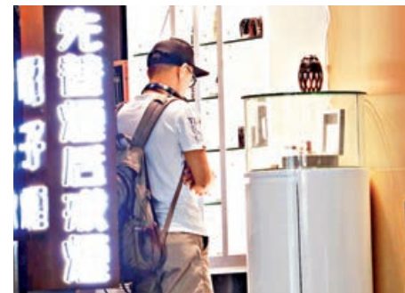
■近年吸食及購買電子煙市民有所增加。

她並表示，政府有計劃用基金成立「中醫藥資源中心」，整合中醫藥參考資料平台讓業界參考，但強調基金運用仍未有最終定案，指政府會繼續諮詢業界再定出申請細節。