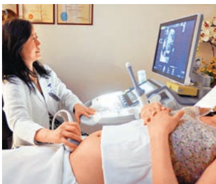
■孕婦需接受產前檢查。資料圖片

特首林鄭月娥在施政報告建議延長法定產假至14星期。勞工及福利局局長羅致光表示，政府承擔月入5萬或以下僱員額外四周產假薪酬，相對外國已是相當不錯安排，並會就《僱傭條例》作技術性修訂，所有產前檢查不論是否有病假紙，均可申請病假。政府同時建議，將流產定義由原本懷孕最少28周，降到最少24周。醫管局歡迎建議，稱實施新政策每年或涉6,000萬元額外開支。